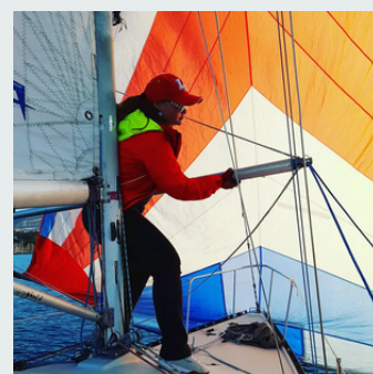
Manoeuvres de port / Spi