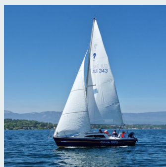
Cours mensuels par niveaux